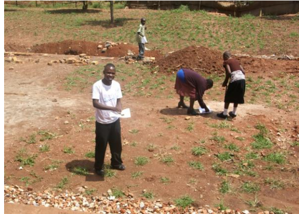
Opdracht buiten voor onderzoek in groep

De docenten bleken zelf snelle leerlingen te zijn. Het was indrukwekkend te zien hoe zij zich vaardigheden in coöperatief onderwijzen eigen maakten en hoe zeer zij zich konden vinden in All children count , ook in hun lessen. Niet alle docenten bleken in staat het hele trainingsprogramma te volgen, maar wie dat wel kon is nu een aanstekelijke voorstander van de nieuwe benadering. Zeker omdat het bestuur van UP4S ook voor de condities zorgt waardoor dit mogelijk is.