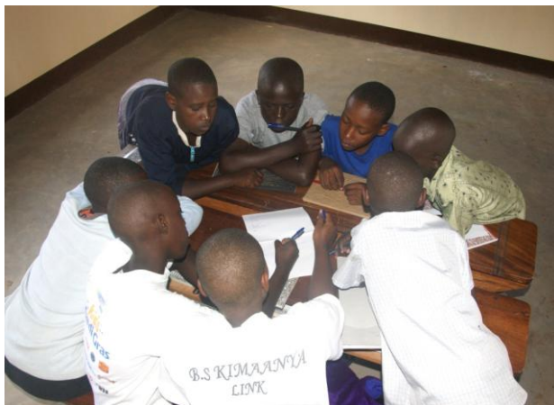
Plan opstellen in subgroep