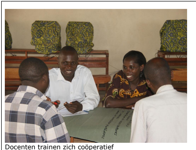
Docenten trainen zich coöperatief

Er is geen weg terug, zij het dat deze benadering nu en dan onderhoud vraagt, zeker als er nieuwe collega's bijkomen.